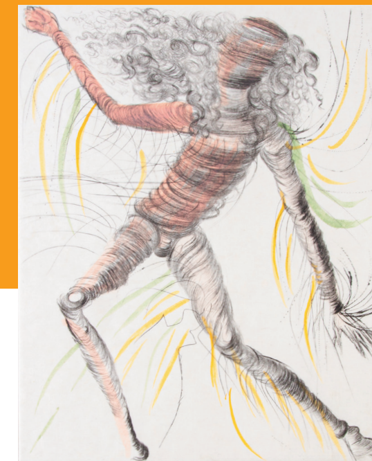
Der Kosmonaut © Salvador Dalí, Fundació Gala-Salvador Dalí / VG Bild-Kunst, Bonn 2024