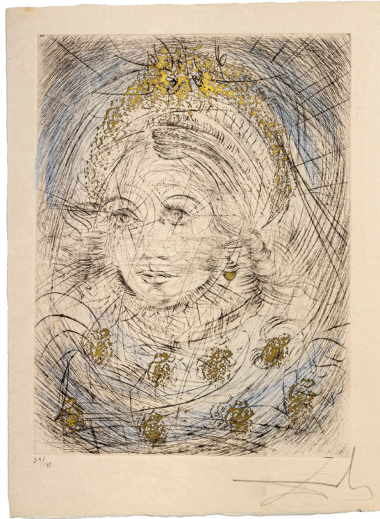
Margarete © Salvador Dalí, Fundació Gala-Salvador Dalí / VG Bild-Kunst, Bonn 2024