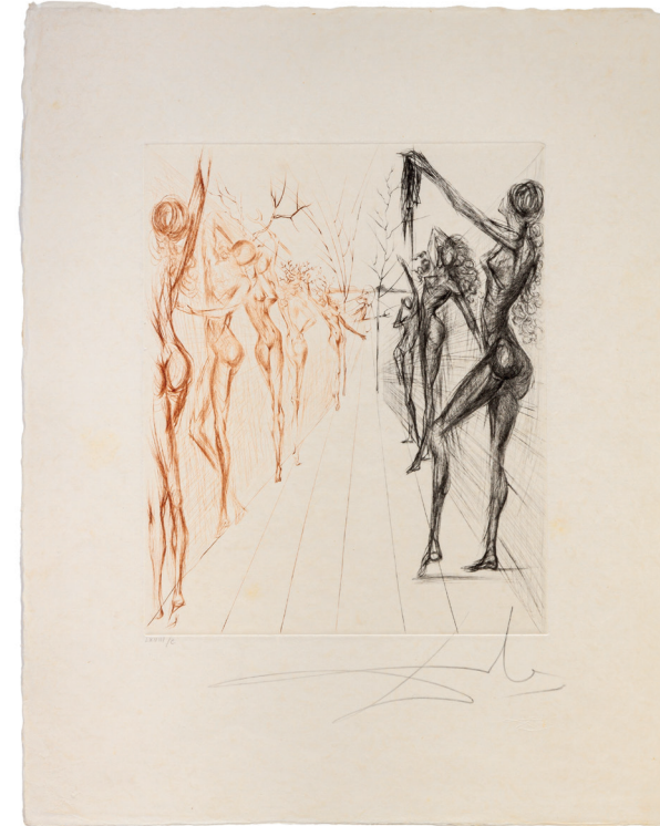
Katmandu-Korridor © Salvador Dalí, Fundació Gala-Salvador Dalí / VG Bild-Kunst, Bonn 2024

Der Katalog ist in unserem Onlineshop erhältlich unter www.stadtmuseum-stockach.de oder vor Ort in unserem Museumsshop mit vielen weiteren Dalí-Produkten.