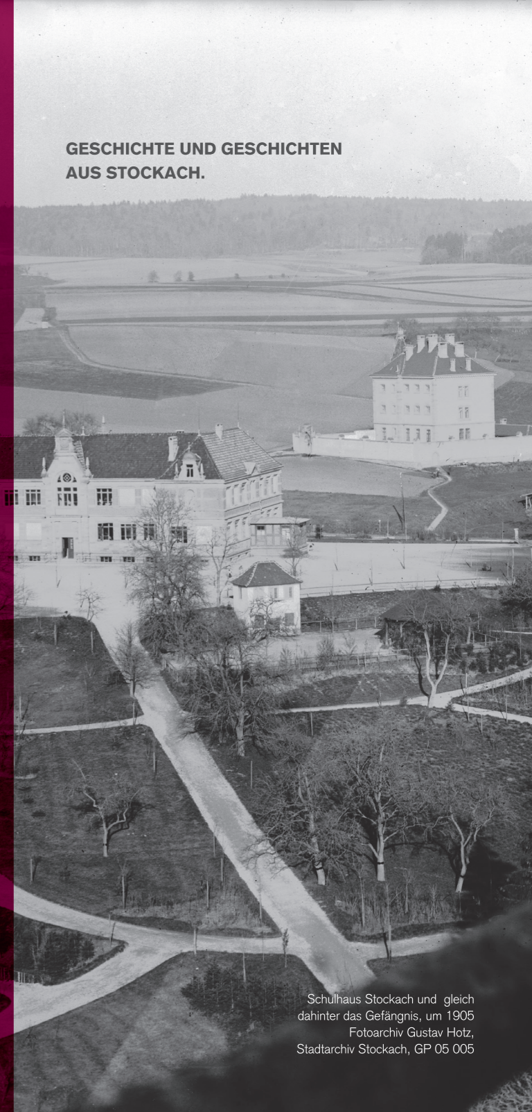
Schulhaus Stockach und gleich dahinter das Gefängnis, um 1905 Fotoarchiv Gustav Hotz, Stadtarchiv Stockach, GP 05 005