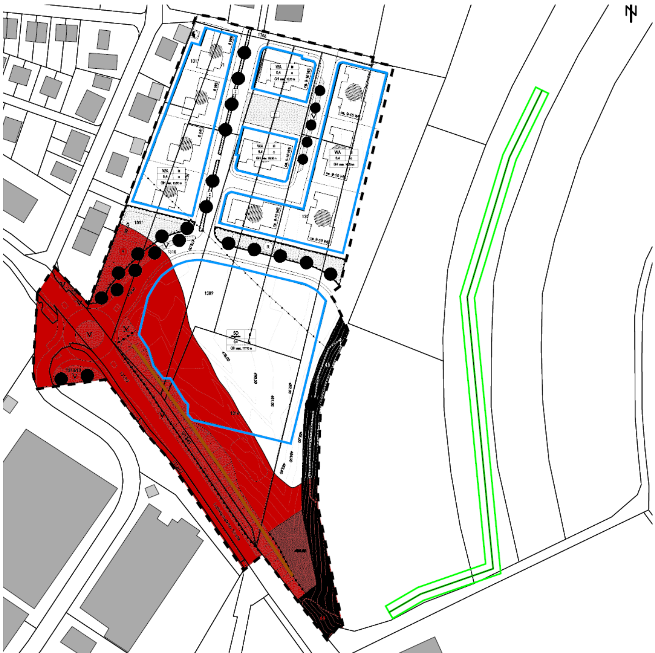
Abb. 3: Bereiche > 62 dB(A) tags