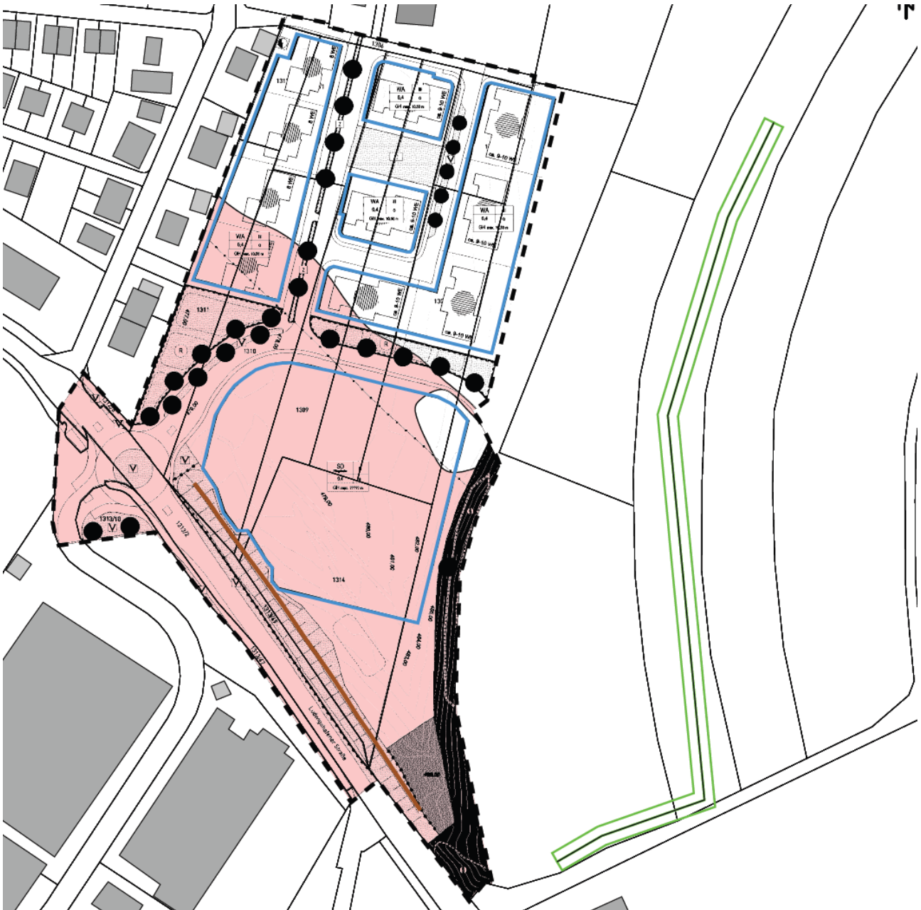
Abb. 2: Bereiche > 50 dB(A) nachts

Für die Fassaden, die in den in der nachfolgenden Abbildung hellrot gekennzeichneten Bereichen liegen, sind in den für das Schlafen genutzten Räumen schallgedämmte Lüftungselemente vorzusehen, wenn der notwendige Luftaustausch während der Nachtzeit nicht auf andere Weise (z.B. durch ein weiteres an einer lärmabgewandten Fassade befindliches Fenster) sichergestellt werden kann.